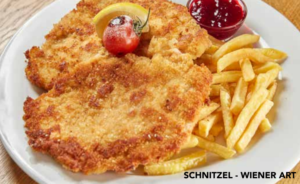
SCHNITZEL - WIENER ART