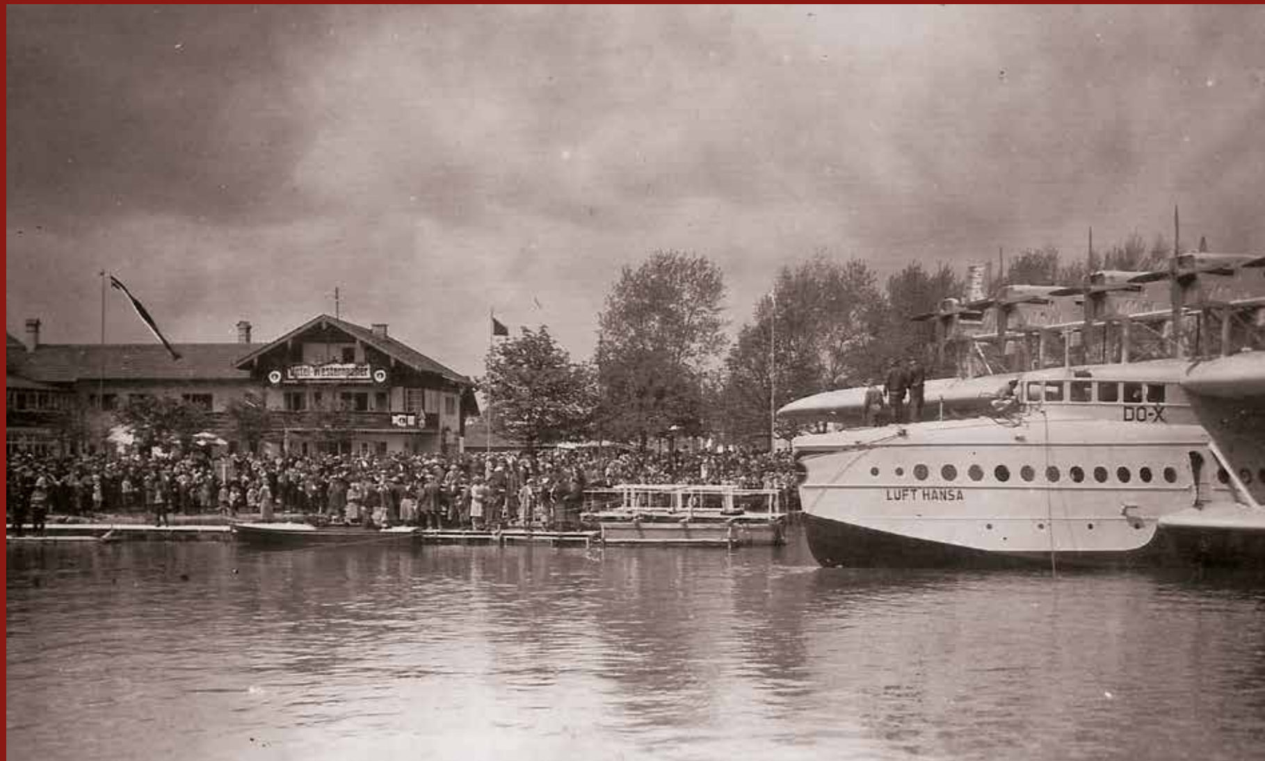
Lufthansa Dornier DO-X am Westernacher - 1932