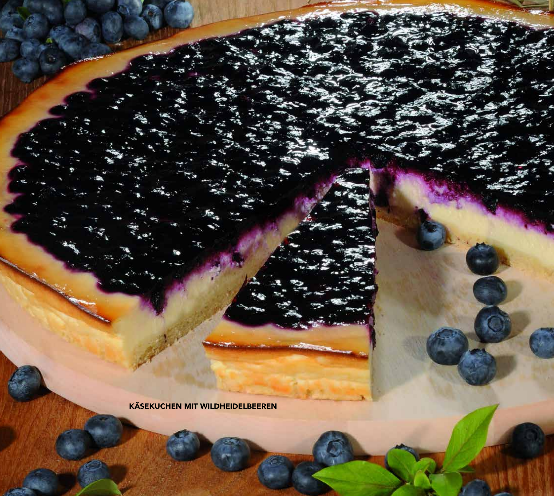
KÄSEKUCHEN MIT WILDHEIDELBEEREN