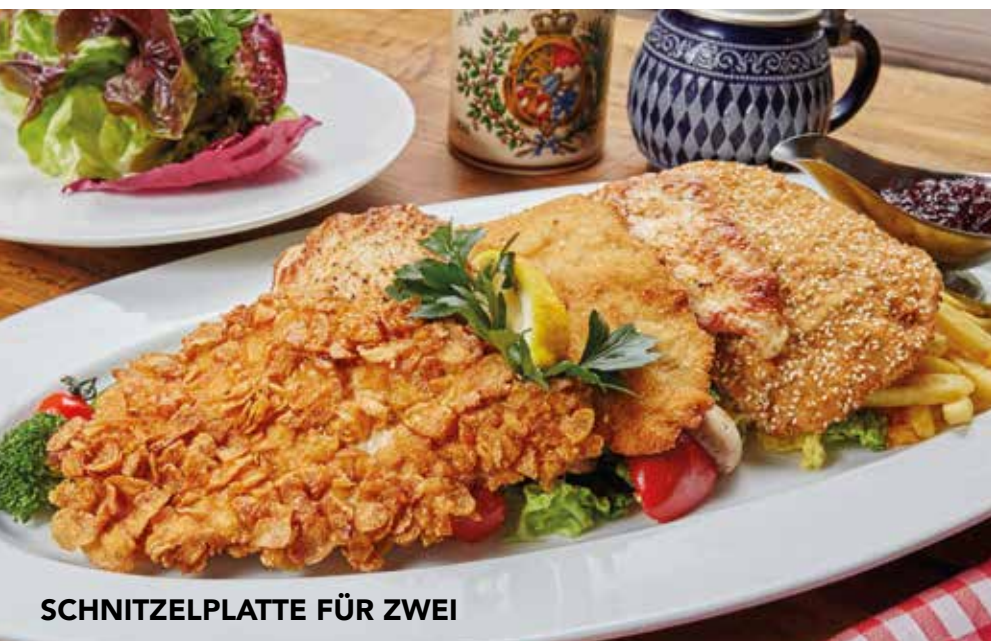
SCHNITZELPLATTE FÜR ZWEI

Vom Schwein, paniert, gefüllt mit gek. Schinken 2,3,10 und Emmentaler Käse 2 , dazu Pommes Frites 3,4,5 und Wildpreiselbeeren 1