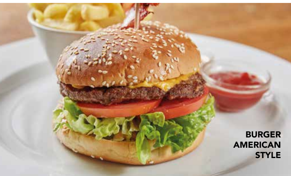
BURGER AMERICAN STYLE