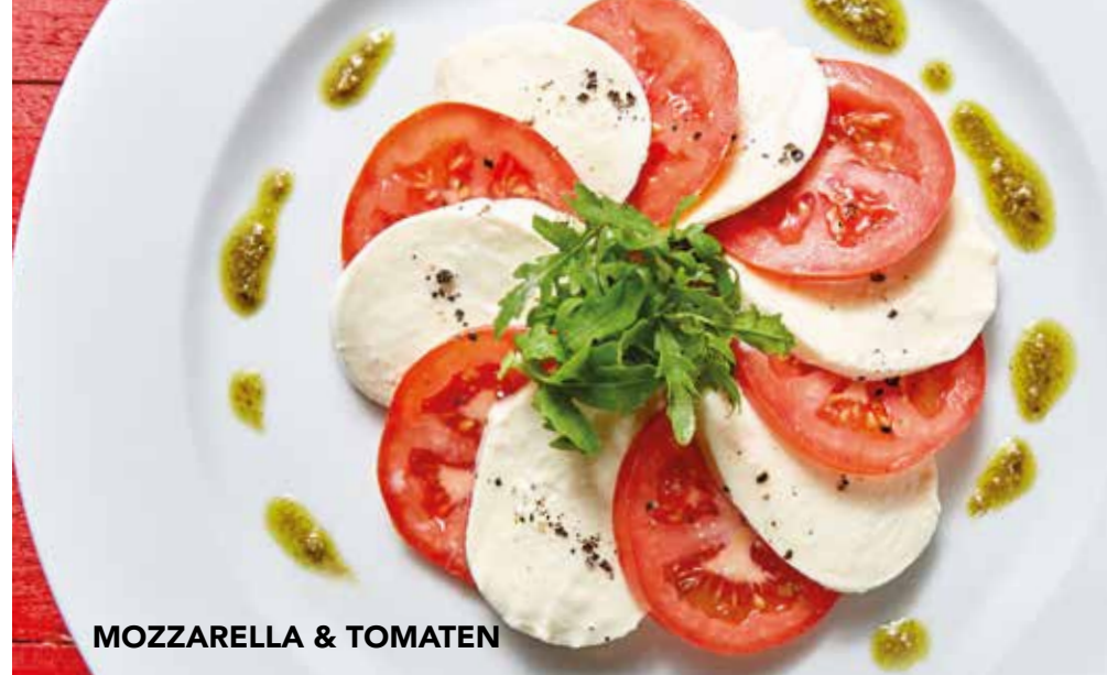
MOZZARELLA & TOMATEN