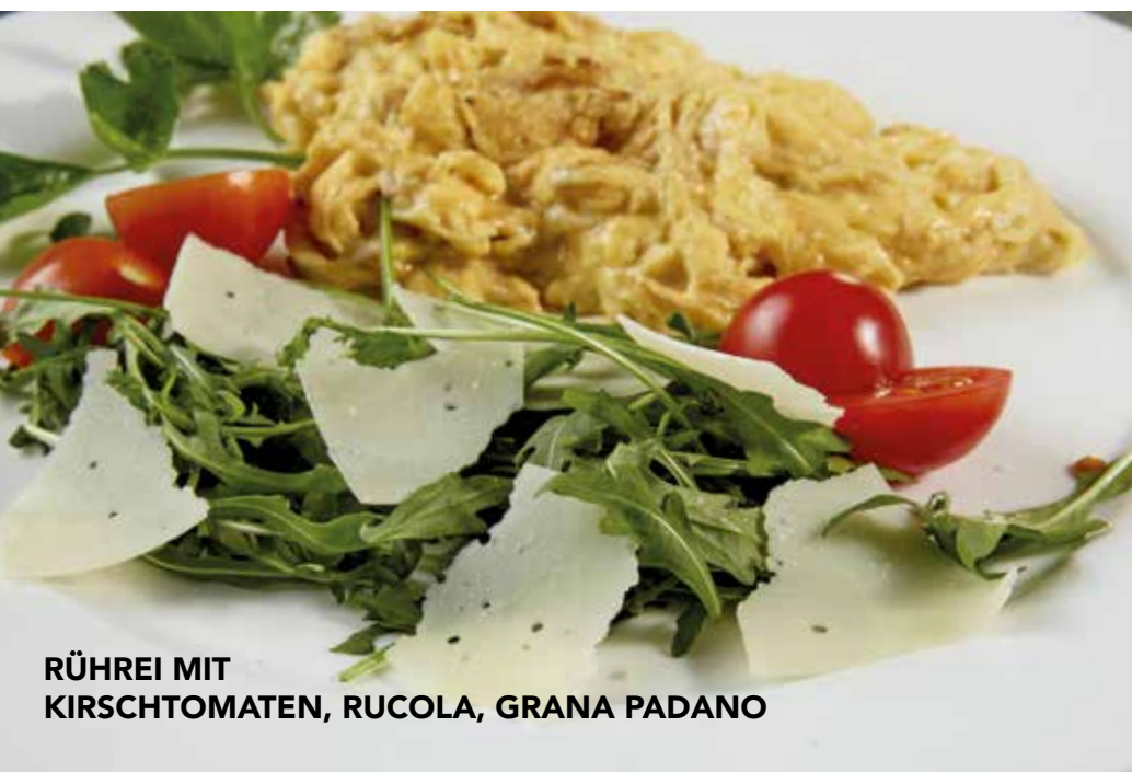
RÜHREI MIT KIRSCHTOMATEN, RUCOLA, GRANA PADANO