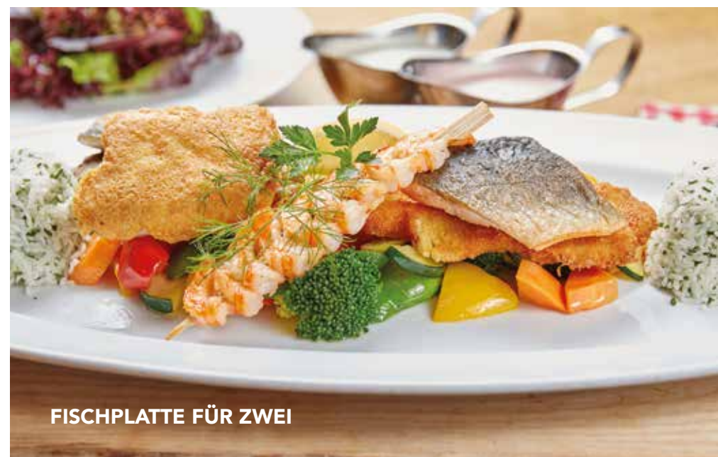
FISCHPLATTE FÜR ZWEI

Auf Kartoffelspalten mit frittiertem Rucola