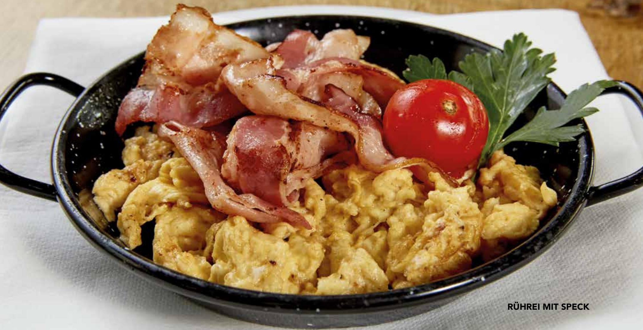
RÜHREI MIT SPECK